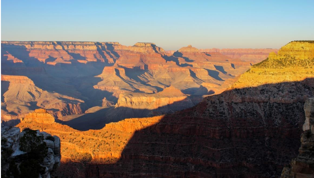
Bilde fra solnedgang ved south rim, Grand Canyon

05:45 neste morgen satte flesteparten av studentene og Allan Krill av gårde ned Bright Angel Trail i håp om å komme seg ned til Colorado River og tilbake opp i løpet av dagen. Sola kom frem rett etter start, og etter tre timer og 1300 høydemeter hadde samtlige startere kommet seg ned til elven. Det ble bading, soling og fotografering før turen gikk tilbake opp. Uttørket og noe solbrent kom alle seg helskinnet, men slitne, opp igjen. Noen heldige fikk tatt en dusj på et offentlig bad, noen spylte seg i bilvasken, andre uttalte at de ikke skulle dusje før neste uke.