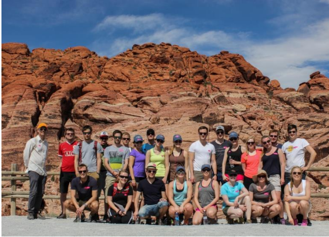
Gruppebilde i Red Rock Canyon