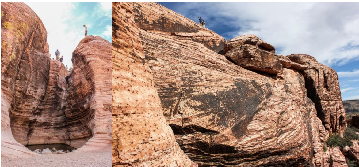
Store kryssjikt og groper i Red Rock Canyon