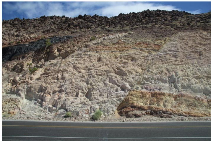
Veiskjæring med vulkansk glass og forkastninger utenfor Shoshone

Fredag 11. april ble første stopp veiskjæringen som så vidt var besøkt dagen i forveien. Oppgaven var å observere, skissere og diskutere hva som hadde skjedd. Et lag med et mørkt materiale lignet kull på avstand, men det viste seg å være vulkanitter/vulkansk glass fra Miocen tid (ca. 23 - 5 Ma), noe som er typisk for store deler av Las Vegas-området. Det var også flere forkastninger i veiskjæringen; Ekstensjonsforkastninger, som også er gjennomsettende for området.