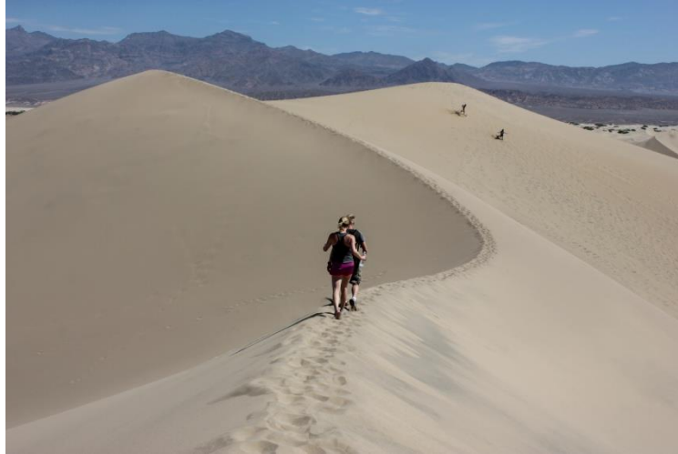
Noen studenter tok turen hele veien til toppen av stjernesanddynene.

Neste stopp var Mosaic Canyon, hvor hele dalen er glattpolert på grunn av «slurries» som skyller gjennom dalen når det kommer kortvarige, intense flommer. Det var også tydelige strukturgeologiske fenomener der, blant annet en-echelon tensjonsårer, sigmaklaster og spektakulære folder.